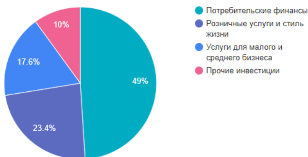
Структура выручки TCS Group Holdings